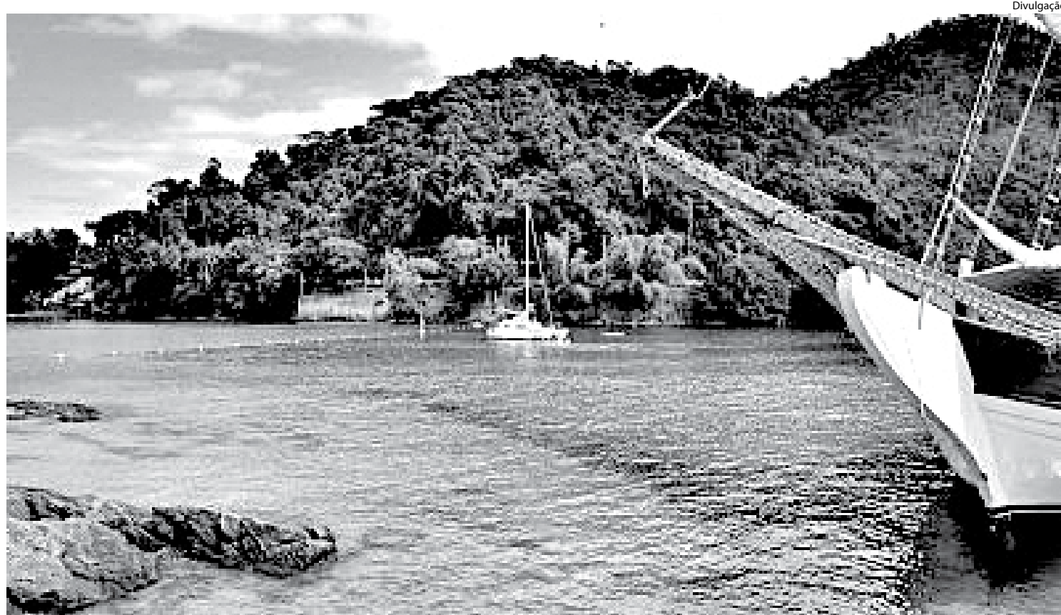
ANGRA DOS REIS é o principal destino dos turistas no litoral

Segundo dados do SindHotéis Rio atualmente, 93,09% dos leitos da rede hoteleira estão reservados